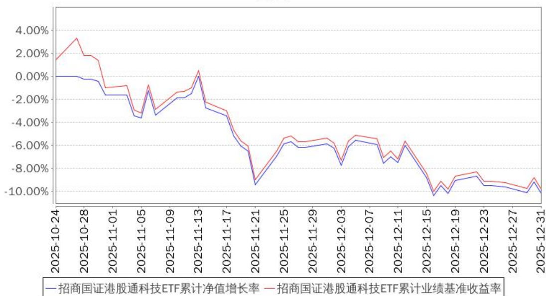
招商国证港股通科技ETF累计净值增长率与同期业绩比较基准收益率的历史走势对比图

注：本基金合同于 2025 年 10 月 24 日生效，截至本报告期末基金成立未满一年；自基金成立之日起 6 个月内为建仓期，截至报告期末基金建仓期尚未结束。