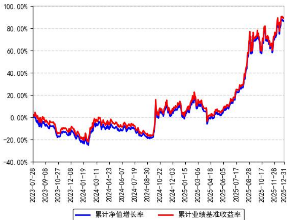
南方中证通信服务ETF累计净值增长率与同期业绩比较基准收益率的历史走势对比图