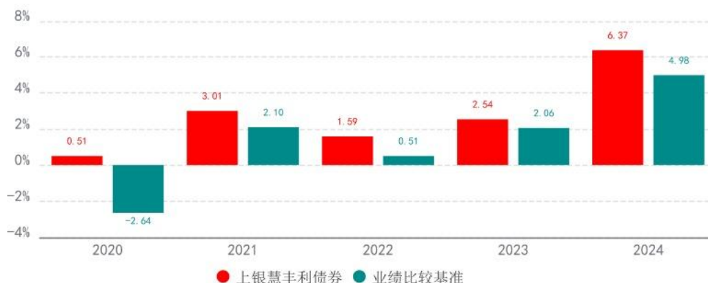
基金的过往业绩不代表未来表现，数据截止日：2024年12月31日