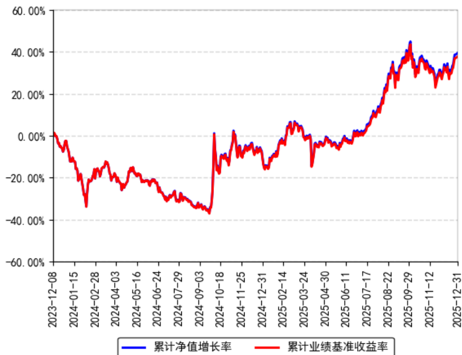
南方上证科创板100ETF累计净值增长率与同期业绩比较基准收益率的历史走势对比图