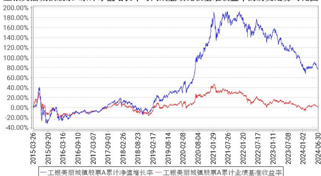
工银美丽城镇股票A累计净值增长率与同期业绩比较基准收益率的历史走势对比图