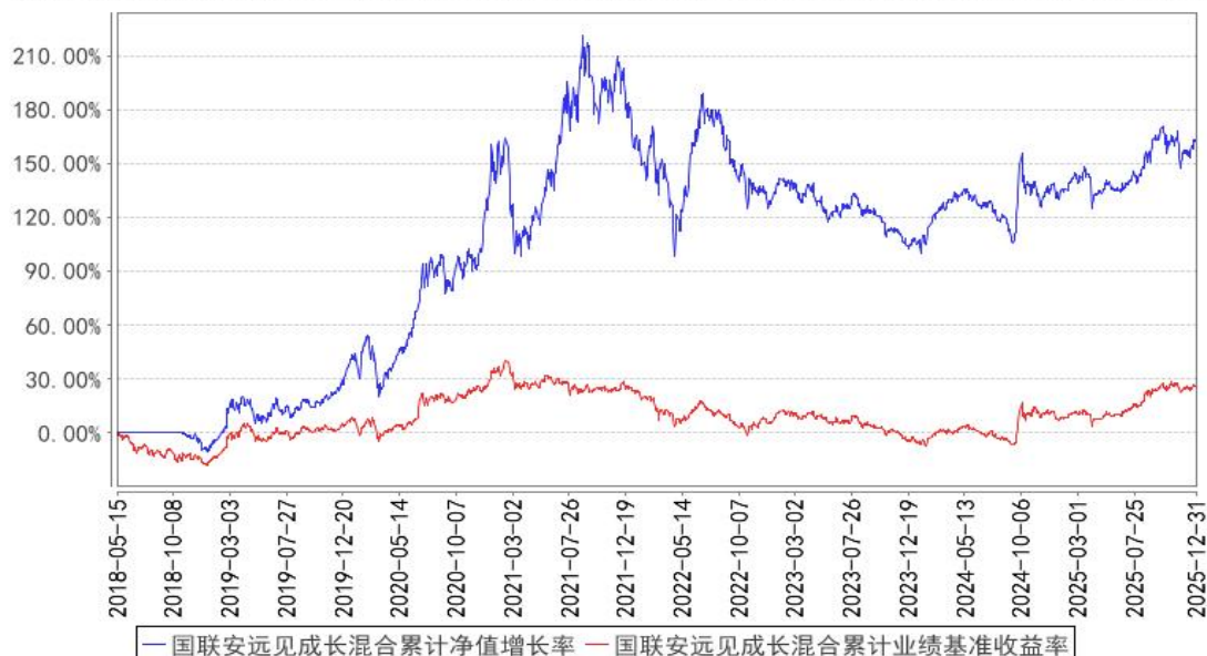
国联安远见成长混合累计净值增长率与同期业绩比较基准收益率的历史走势对比图

注：1、本基金业绩比较基准为：沪深 300 指数收益率*75%+上证国债指数收益率*25%； 2、本基金基金合同于 2018 年 5 月 15 日生效。本基金建仓期为自基金合同生效之日起的 6 个月，建仓期结束时各项资产配置符合合同约定。