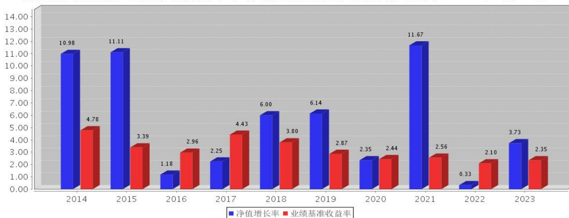
安信目标收益债券C基金每年净值增长率与同期业绩比较基准收益率的对比图（2023年12月31日）