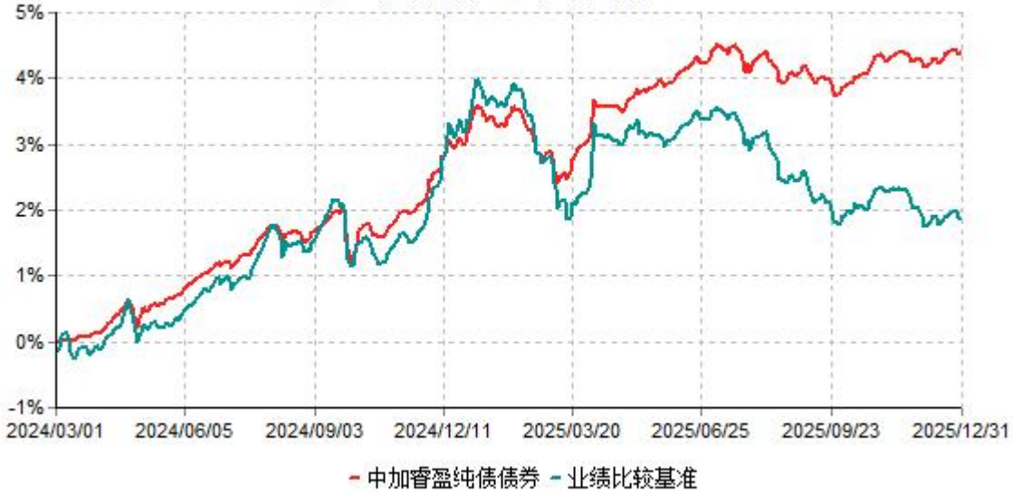
中加睿盈纯债债券累计净值增长率与业绩比较基准收益率历史走势对比图 (2024年03月01日-2025年12月31日)

注：1、本基金基金合同于2024年3月1日生效，截止报告期末，本基金的基金合同生效已满一年。