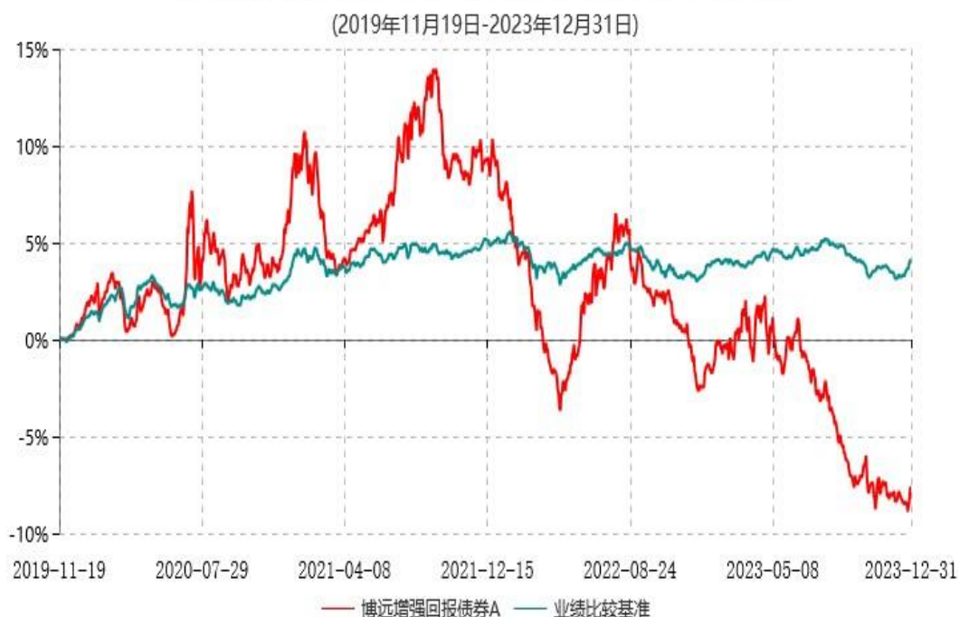
博远增强回报债券A累计净值增长率与业绩比较基准收益率历史走势对比图