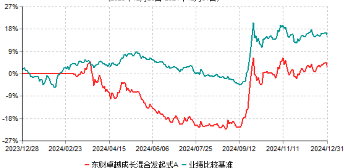
东财卓越成长混合发起式A累计净值增长率与业绩比较基准收益率历史走势对比图 (2023年12月28日-2024年12月31日)