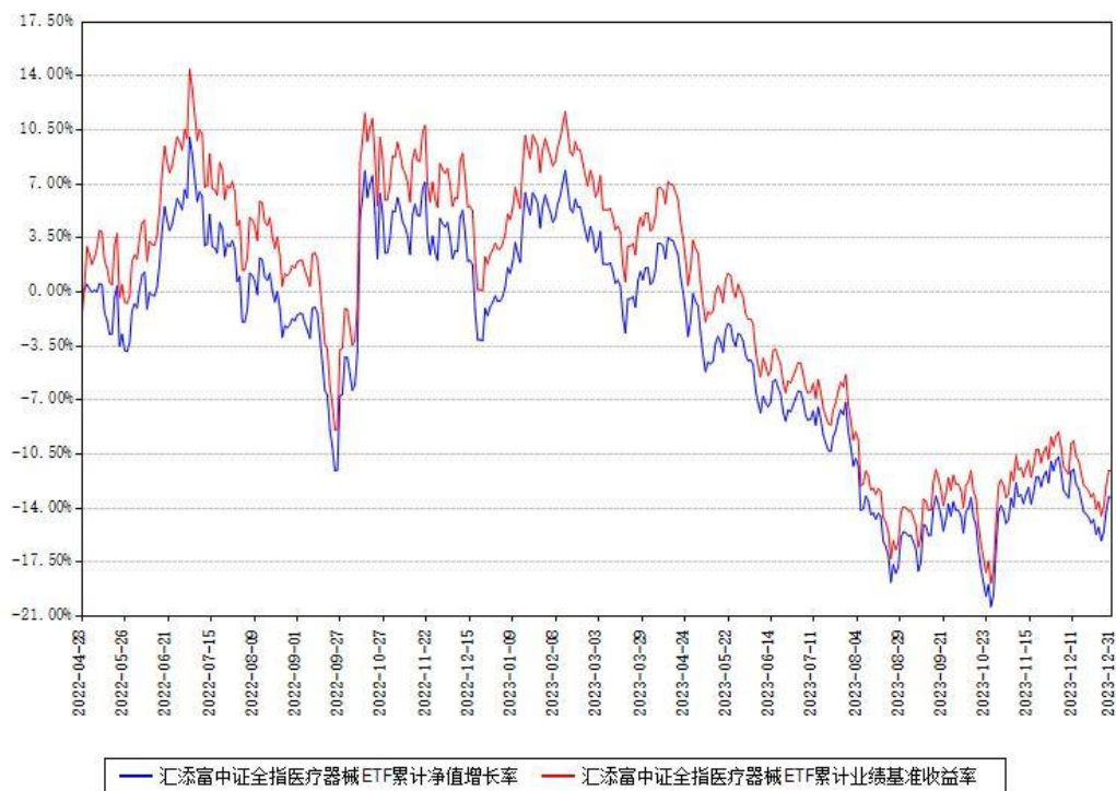
汇添富中证全指医疗器械ETF累计净值增长率与同期业绩基准收益率对比图

(二) 自基金合同生效以来基金累计净值增长率变动及其与同期业绩比较基准收益率变动的比较图