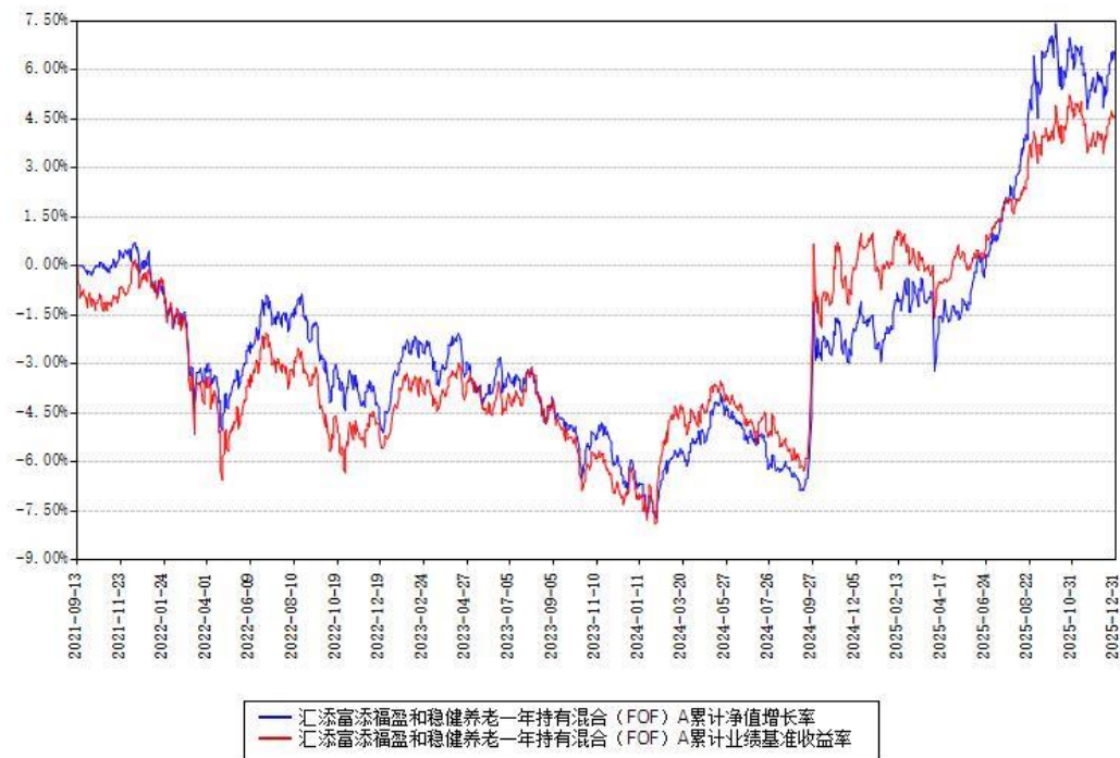
汇添富添福盈和稳健养老一年持有混合（FOF）Y 累计净值增长率与同期业绩基准收益率对比图