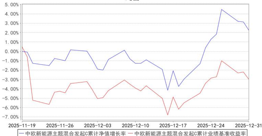
中欧新能源主题混合发起C累计净值增长率与同期业绩比较基准收益率的历史走势对比图

注：本基金基金合同生效日期为 2025 年 11 月 19 日，自基金合同生效日起到本报告期末不满一年，按基金合同的规定，本基金自基金合同生效起六个月为建仓期，建仓期结束时各项资产配置比例应当符合基金合同约定。