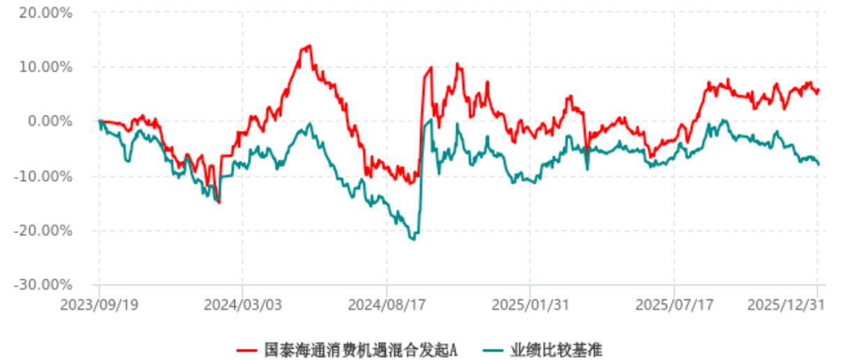
国泰海通消费机遇混合发起A累计净值增长率与业绩比较基准收益率历史走势对比图 (2023年09月19日-2025年12月31日)