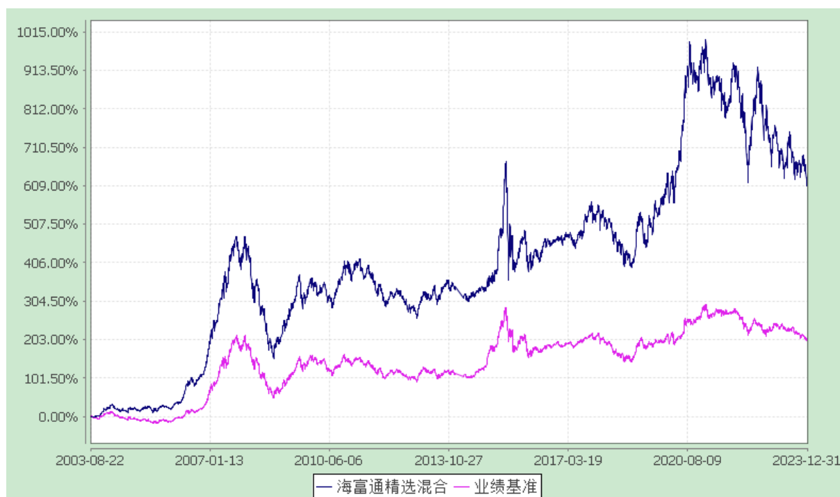
海富通精选证券投资基金 份额累计净值增长率与业绩比较基准收益率的历史走势对比图 (2003 年 8 月 22 日至 2023 年 12 月 31 日)

注：1、按基金合同规定,本基金自基金合同生效起 6 个月内为建仓期。本基金自 2007 年 6 月 28 日至 2007 年 9 月 29 日,为持续营销后建仓期。建仓期满至今,本基金投资组合均达到本基金合同第十八条(三)、(六)规定的比例限制及本基金投资组合的比例范围。 2、为了能更公允地体现基金投资业绩,海富通基金管理有限公司自 2007 年 1 月 1 日起调整海富通精选基金业绩比较基准中股票部分的基准。原比较基准中的上证指数调整为 MSCI China A 指数,相应的基准权重不变。