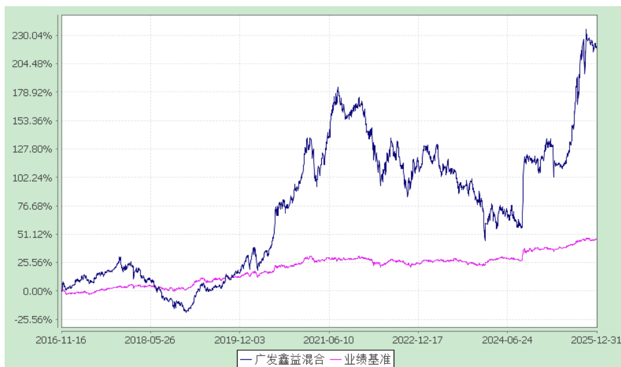
广发鑫益灵活配置混合型证券投资基金 份额累计净值增长率与业绩比较基准收益率的历史走势对比图 (2016年11月16日至2025年12月31日)