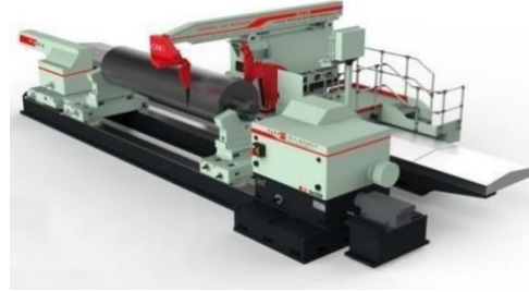
造纸轻纺行业轧辊磨床