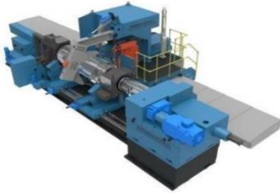
钢铁行业轧辊磨床

MK8480、MK8463、MGK8440、MKT 系列等，可覆盖下游客户金属板材轧制生产线各类应用领域以及造纸、轻纺制造等环节的定制化需求，相关设备已经大量应用于宝武集团、鞍钢集团、河钢集团、首钢集团、山钢集团等国内知名企业，并已打入印度、马来西亚、泰国、越南等新兴国际市场。