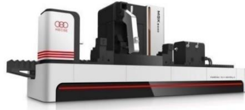
机械加工行业轧辊磨床