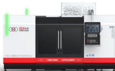
亚微米级高端复合磨削系列产品

亚微米级高端复合磨削系列产品属于高精度数控万能复合磨床，是公司近年重点推出的高精度、多功能、复合型转塔式数控磨削装备，具有外圆、内圆、非圆、端面、轮廓、螺纹等磨削功能，目前已形成完整的产品体系，包括亚 \mu 磨削中心、亚 \mu 外圆磨床、亚 \mu 内圆磨床、亚 \mu 端面磨床、亚 \mu 随动磨床、亚 \mu 中心孔磨床等，其夹持磨削圆度最高可达到 0.2\mu\text{m} ，相关核心技术指标比肩国际顶尖企业同类产品先进水平。公司根据下游客户的功能需求可以进行柔性化配置，以满足不同用户的多种精密磨削需求。作为国家关键技术领域被卡脖子的核心精密磨削装备，该系列产品将为我国工业母机、机器人制造、工程机械、航空航天、汽车零部件制造、装备制造、精密仪器制造等领域提供重要支撑，进一步提高我国机床产业和相关核心功能部件的整体技术水平和行业国际竞争力。