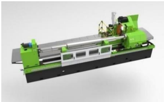
有色金属行业轧辊磨床