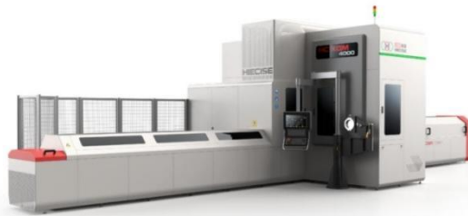
数控直线导轨磨床

数控直线导轨磨床为高精度高效率自动化直线导轨专用磨床，可实现对直线导轨的自动磨削、自动误差补偿。公司数控直线导轨磨床配置三个磨头，可同时磨削直线导轨的两侧基准面、滚道面、安装底面，实现一次装夹完成导轨上述表面的磨削加工，有效确保直线导轨垂直方向和水平方向的直线度；该产品通过精密的金刚滚轮修整，能够有效保证砂轮修整的形状精度，保证直线导轨的精度一致性；产品一次装夹可实现两根导轨同时加工。该产品能够为工业母机、机器人制造、航空航天、汽车零部件制造、精密仪器制造等行业关键装备的直线导轨副提供高精度高效率自动化磨削加工，相关核心技术指标对标国际顶尖企业同类产品先进水平。