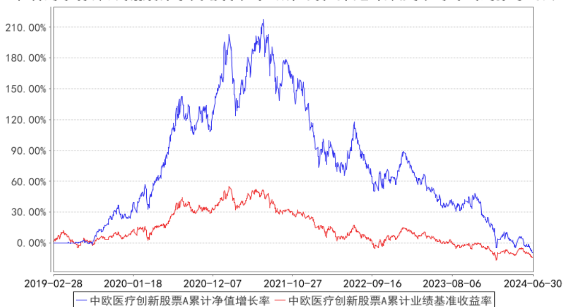
中欧医疗创新股票A累计净值增长率与同期业绩比较基准收益率的历史走势对比图