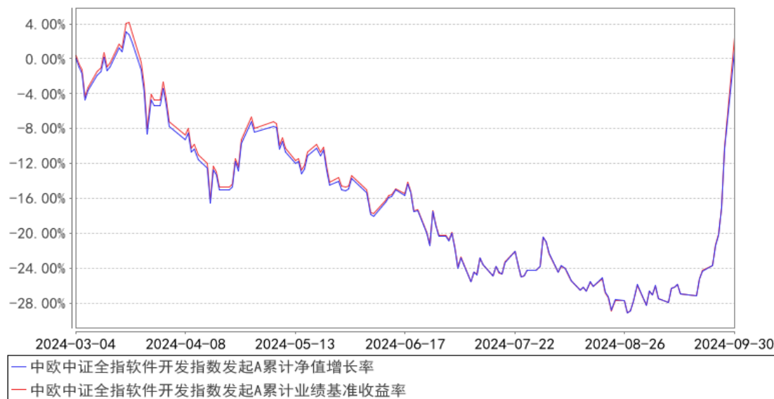
中欧中证全指软件开发指数发起A累计净值增长率与同期业绩比较基准收益率的历史走势对比图

注：本基金基金合同生效日期为 2024 年 3 月 4 日，自基金合同生效日起到本报告期末不满一年，按基金合同的规定，本基金自基金合同生效起六个月为建仓期，建仓期结束时各项资产配置比例已经符合基金合同约定。