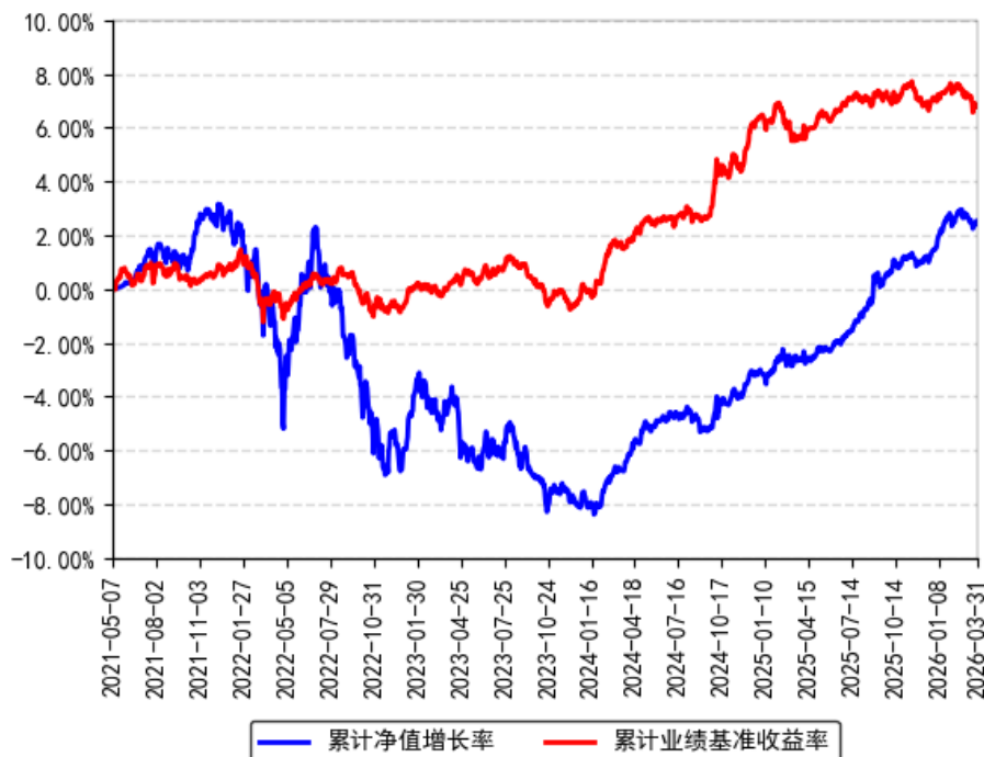
南方晖元6个月持有期债券A累计净值增长率与同期业绩比较基准收益率的历史走势对比图