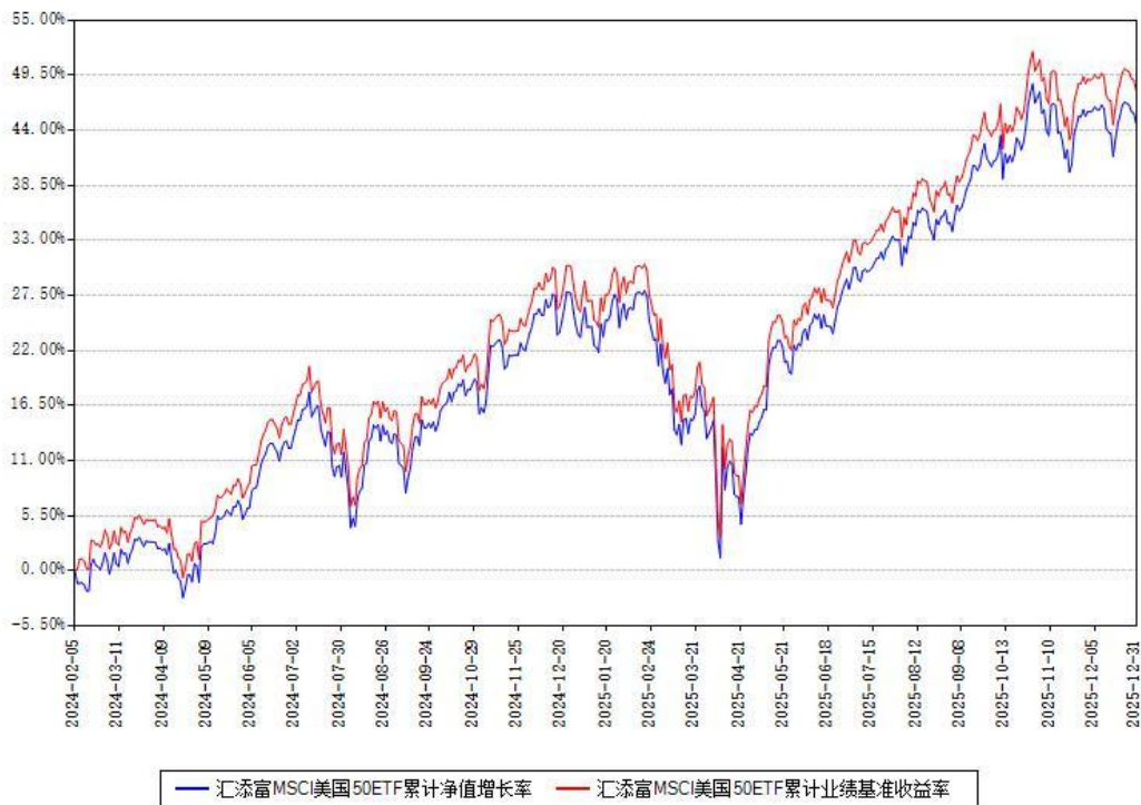
汇添富 MSCI 美国 50ETF 累计净值增长率与同期业绩比较基准收益率对比图

注：本基金建仓期为本《基金合同》生效之日（2024 年 02 月 05 日）起 6 个月，建仓期结束时各项资产配置比例符合合同约定。