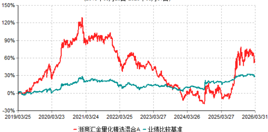
浙商汇金量化精选混合A累计净值增长率与业绩比较基准收益率历史走势对比图 (2019年03月25日-2026年03月31日)