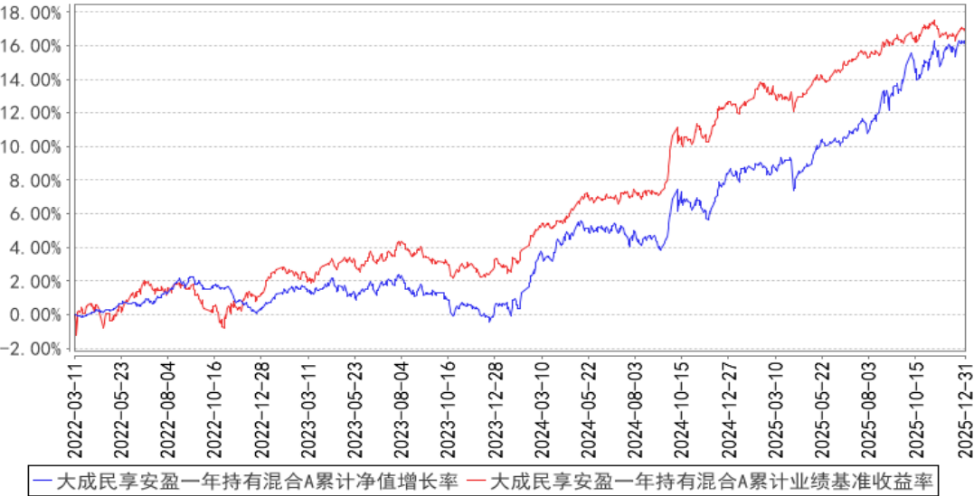
大成民享安盈一年持有混合A累计净值增长率与同期业绩比较基准收益率的历史走势对比图