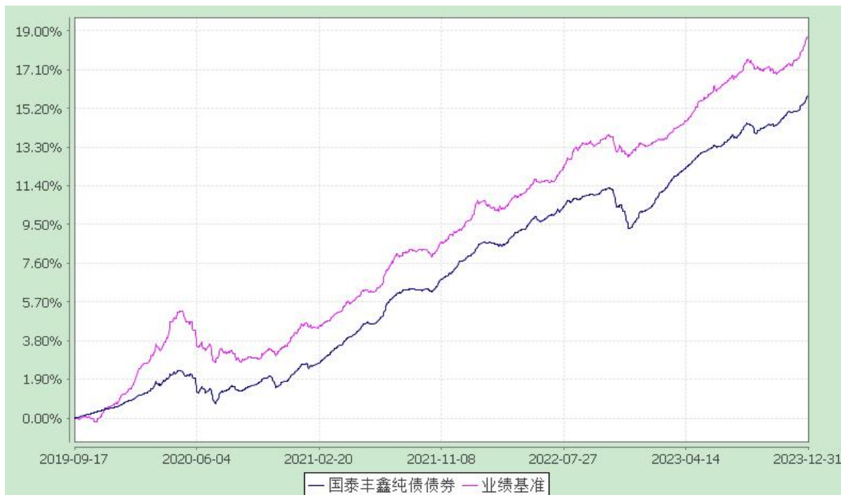
自基金合同生效以来份额累计净值增长率与业绩比较基准收益率的历史走势对比图 (2019 年 9 月 17 日至 2023 年 12 月 31 日)

注：本基金合同生效日为 2019 年 9 月 17 日。本基金在六个月建仓期结束时，各项资产配置比例符合合同约定。