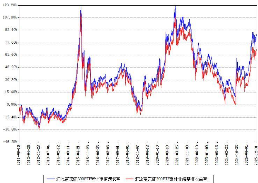
汇添富深证300ETF累计净值增长率与同期业绩基准收益率对比图

注：本基金建仓期为本《基金合同》生效之日（2011年09月16日）起3个月，建仓期结束时各项资产配置比例符合合同约定。