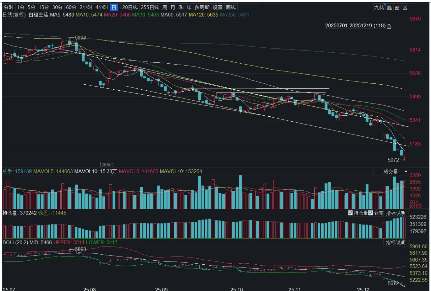
图表 15：白糖主力连续合约日度 K 线

无法改变下跌趋势；结合均线系统以及 MACD 系统维持空头排列，预期短期价格延续下跌趋势，小幅反弹无法扭转下跌趋势，注意仓位管理。