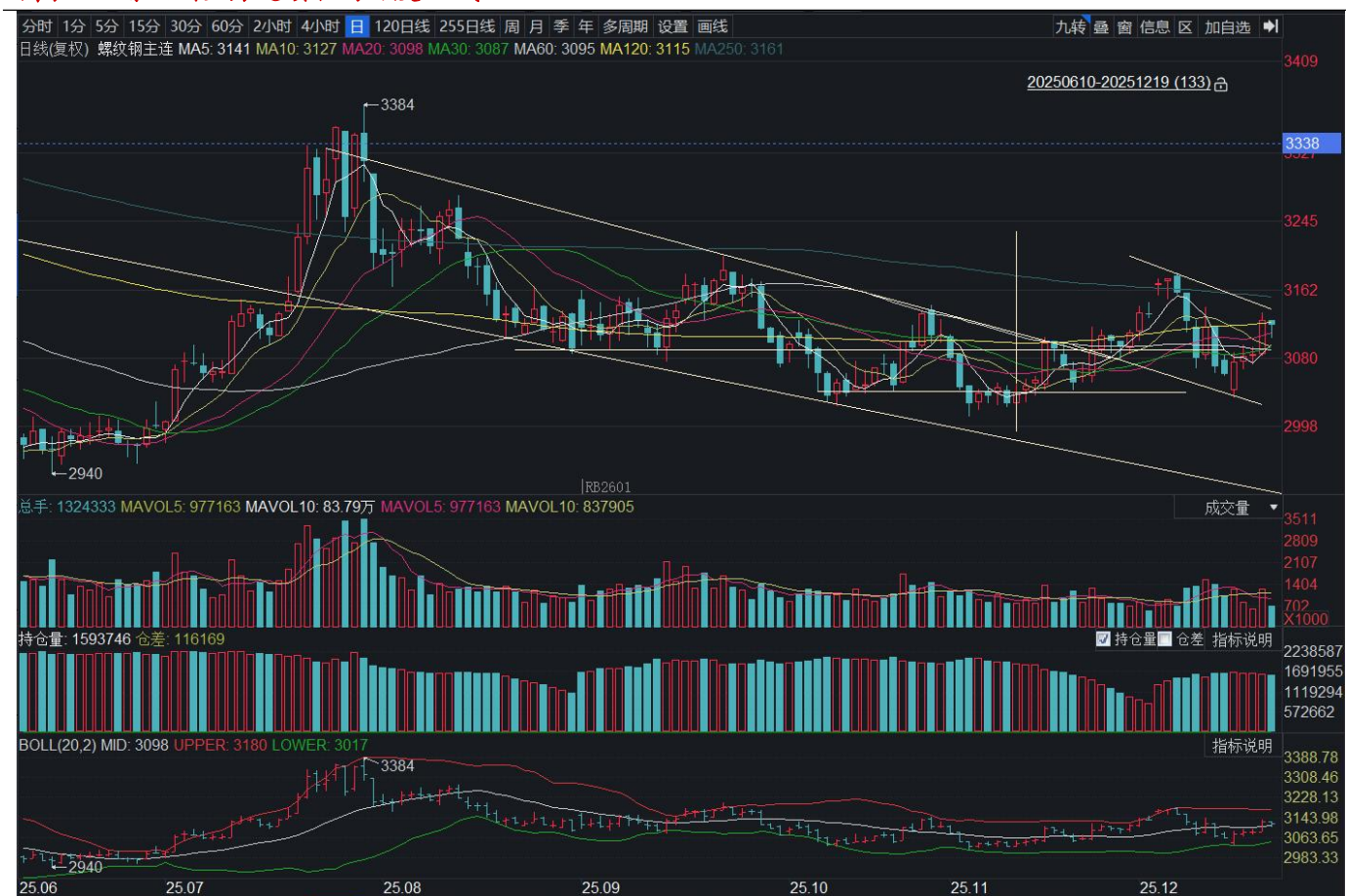
图表 7：螺纹钢主力连续合约日度 K 线