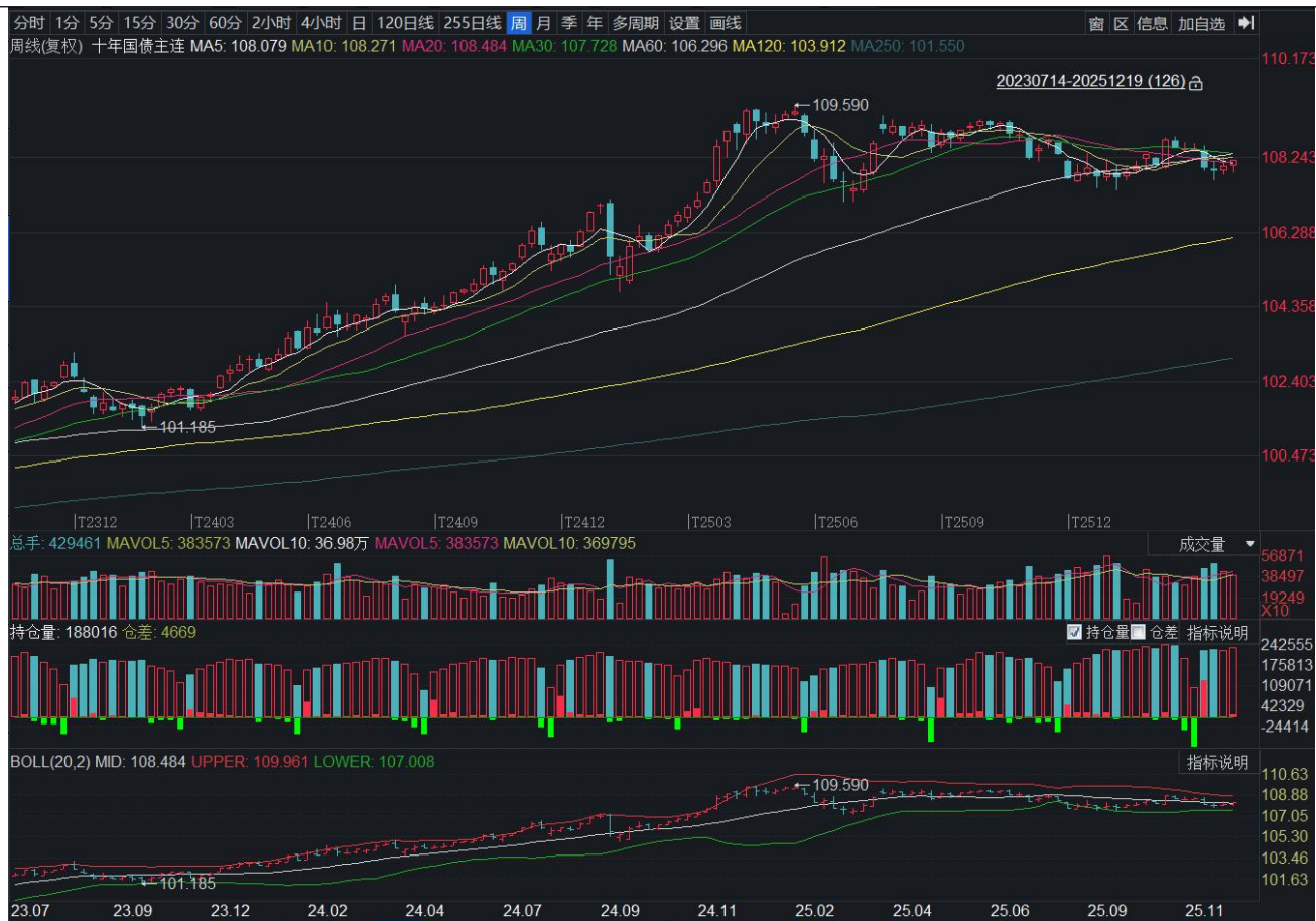
图表 21：十年国债期货主力连续合约周度 K 线