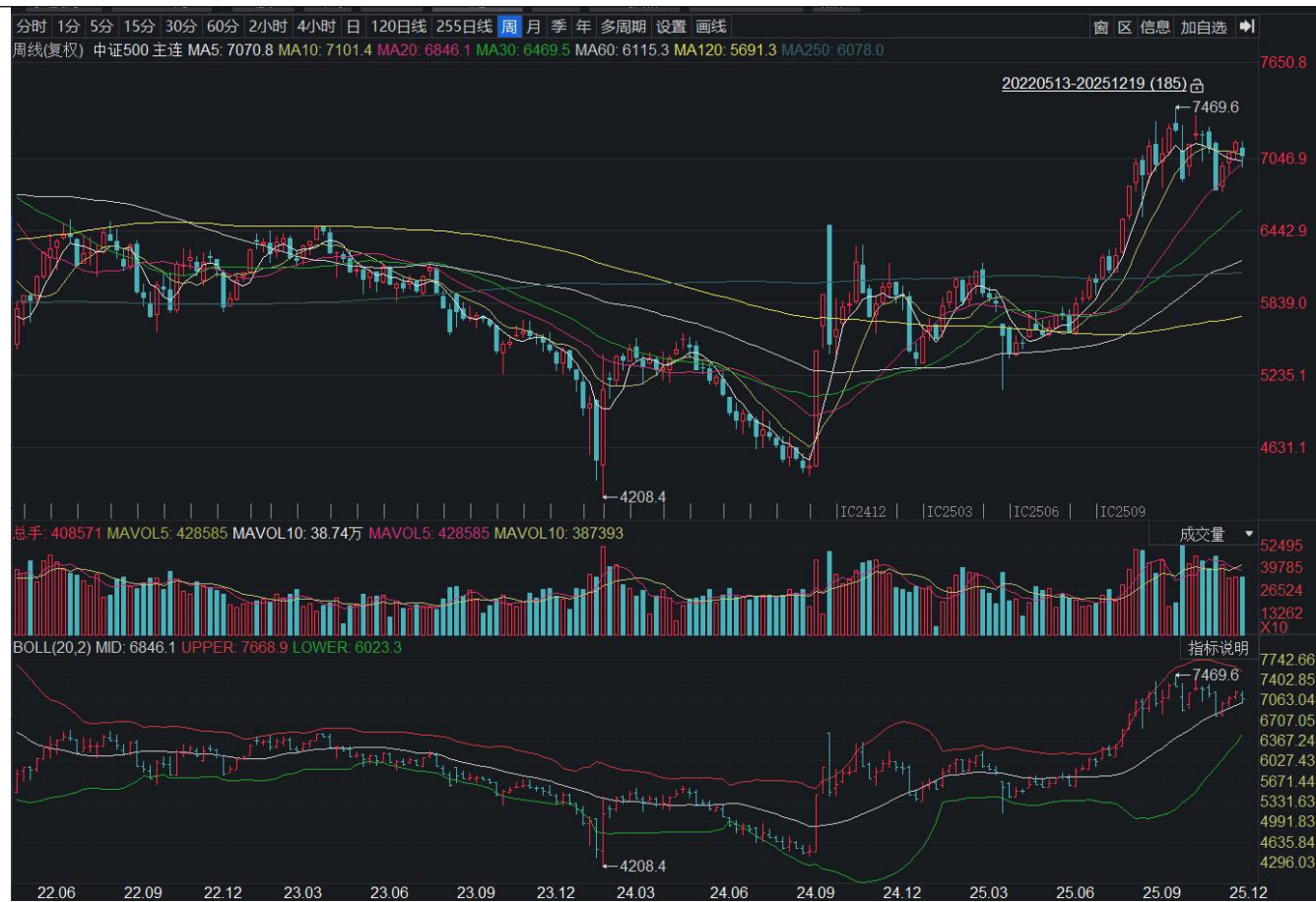
图表 18: 中证 500 期货主力连续合约周度 K 线