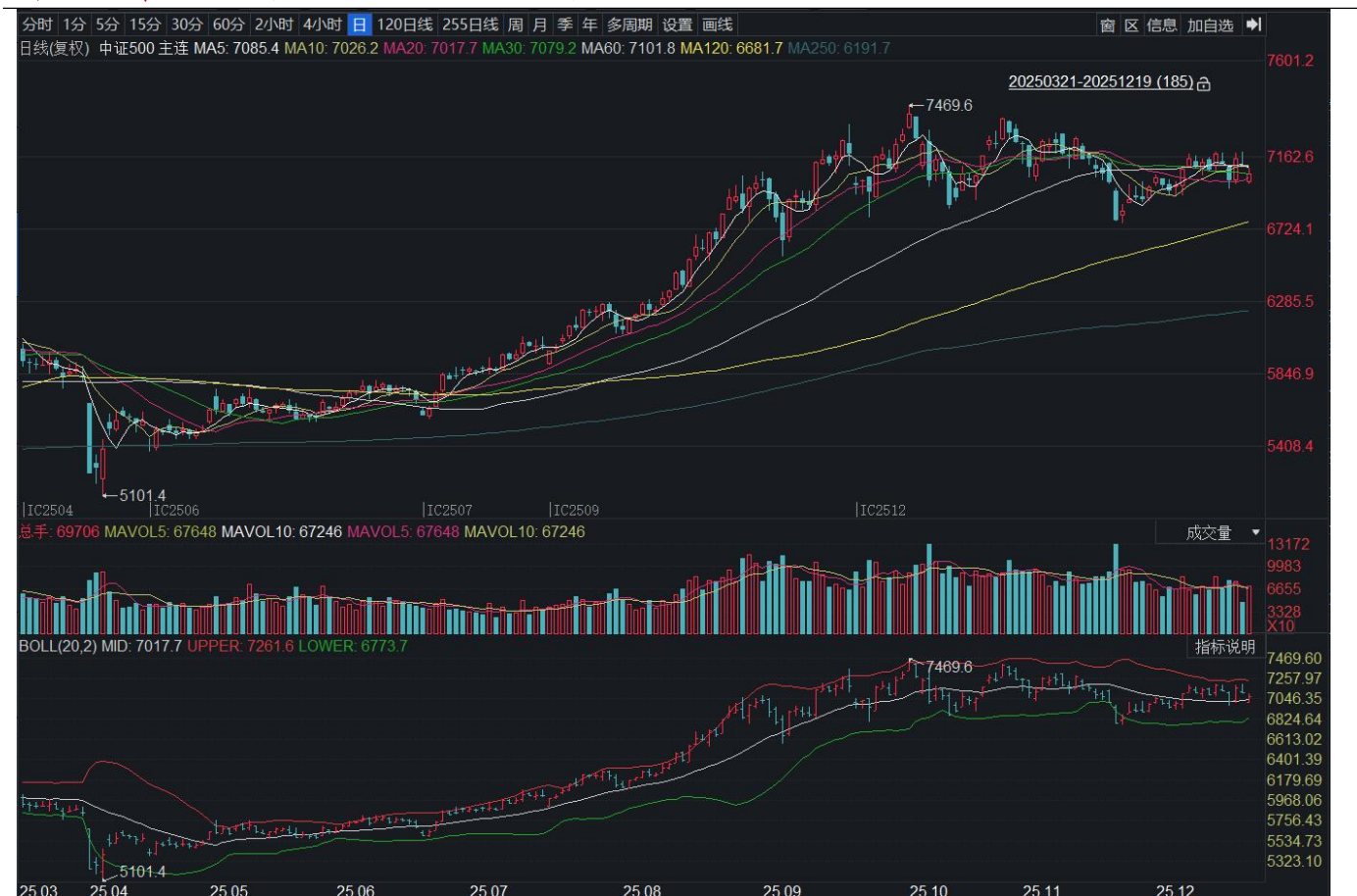
图表 19：中证 500 期货主力连续合约日度 K 线