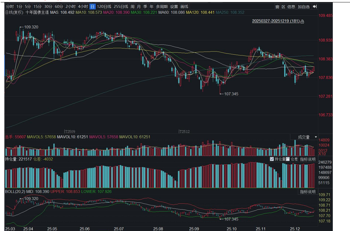
图表 22：十年国债期货主力连续合约日度K线