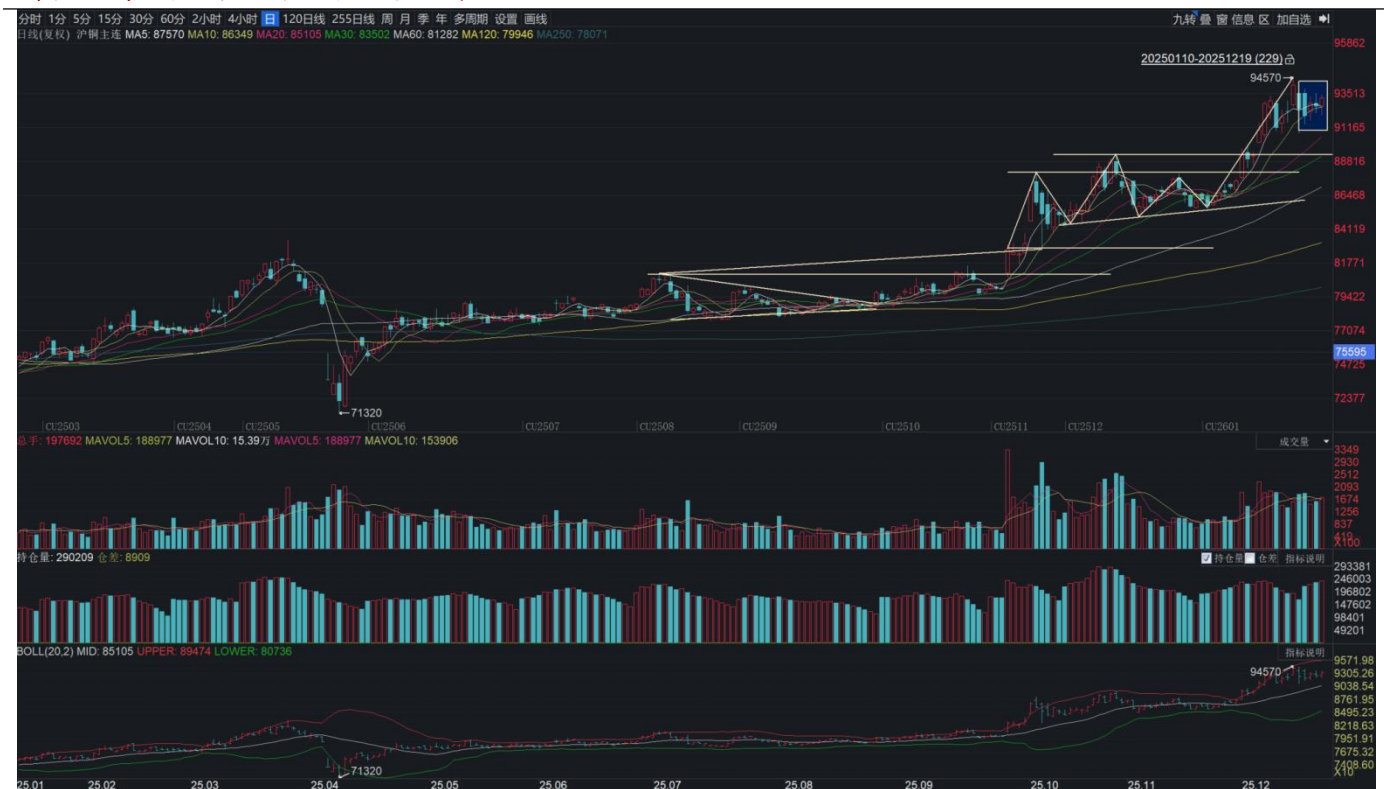
图表 3: 沪铜主力连续合约日度K线