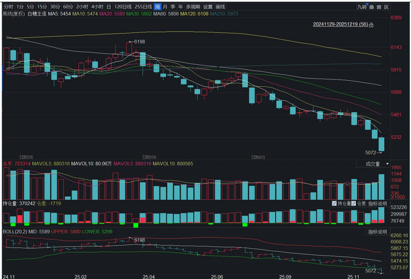
图表 14：白糖主力连续合约周度 K 线

说明：信号汇总包括移动平均信号、动量指标信号、价格形态信号以及重叠研究信号等；信号仅供参考，并不作为投资建议。