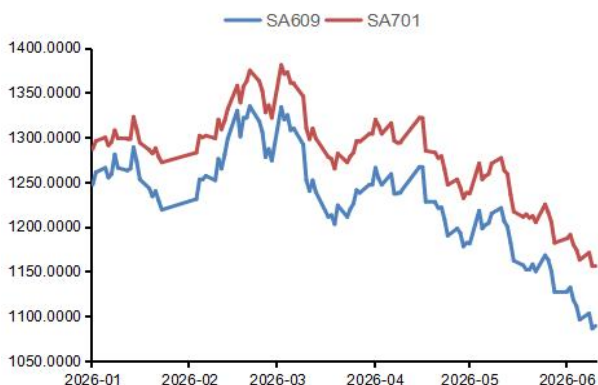
图1：纯碱活跃合约价格走势