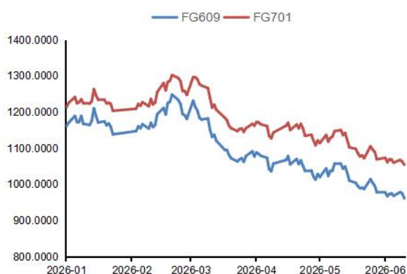
图2：玻璃活跃合约价格走势