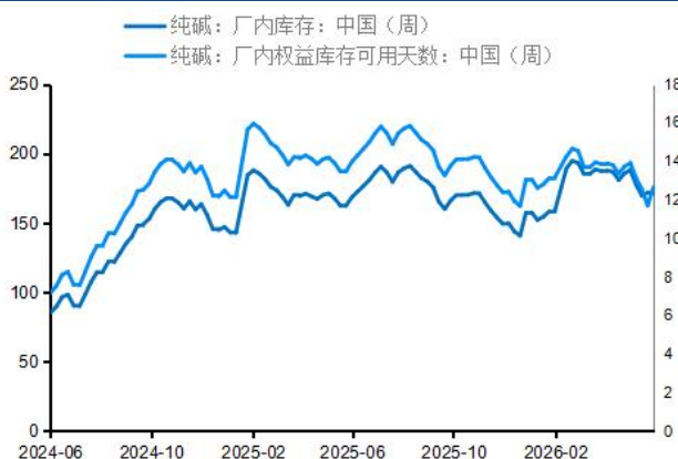
图4：纯碱企业库存及可用天数（万吨、天）