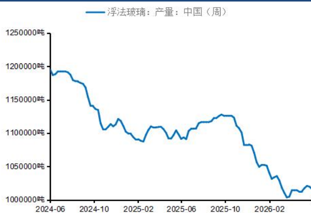
图6：浮法玻璃周度产量（吨）