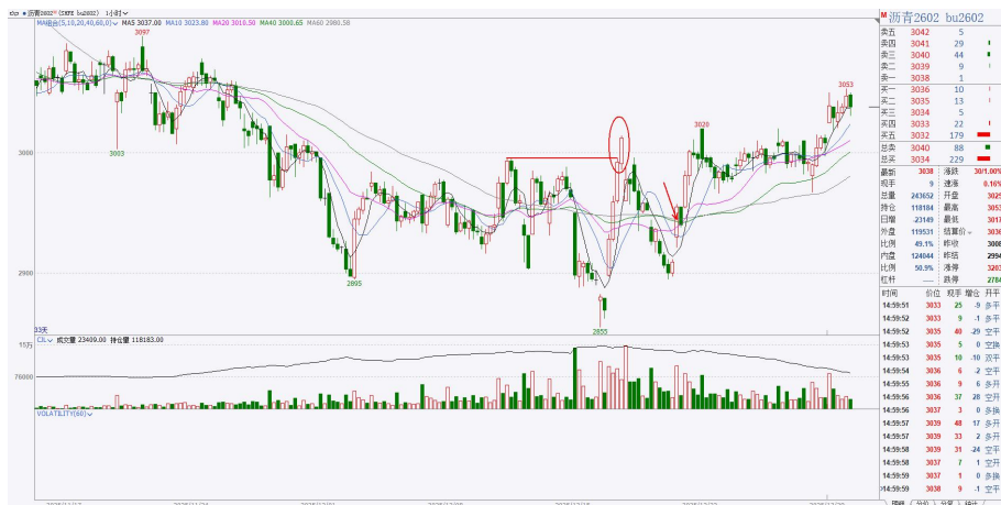
图 2：沥青 2602 小时图

日度技术面追踪：沥青小时级别短期上涨结构，今日创短期新高，但量能有所欠缺未能突破，谨慎对待，下方短期支撑上移 2965 一线，策略上小时级别多单节前可主动止盈半仓，剩余半仓止盈参考 2965 一线。