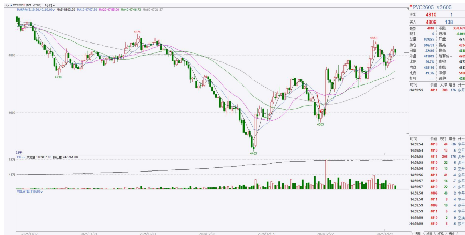
图 9：PVC2605 小时图

日度技术面分析：PVC 日线级别中期下跌结构，小时级别短期上涨结构。今日减仓上行但量能配合不足暂不定为回调结束的确认证号，下方短期支撑 4670-4680 一线。策略上小时周期多单持有，止盈参考 4670-4680 一线。