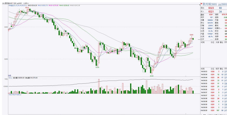
图 7：PP2605 小时图

日度技术面追踪：PP 小时级别短期上涨结构结构。今日增仓上行站上上方短期压力 6315 一线，小时级别结构转多，下方短期支撑 6255 一线。策略上小时周期观望。