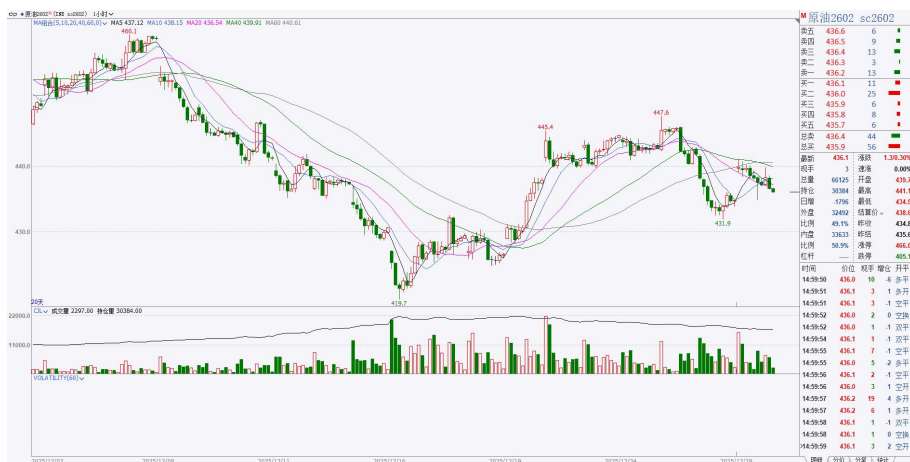
图 1.2：原油 2602 小时图