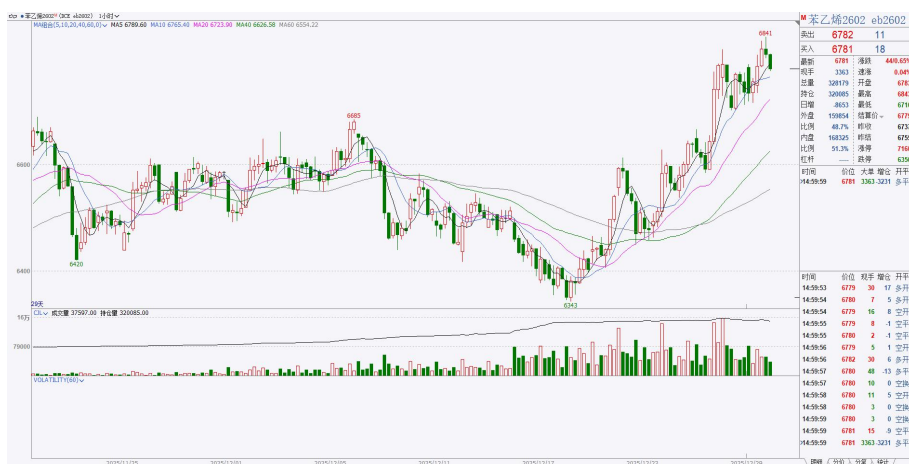
图 2：EB2602 小时图