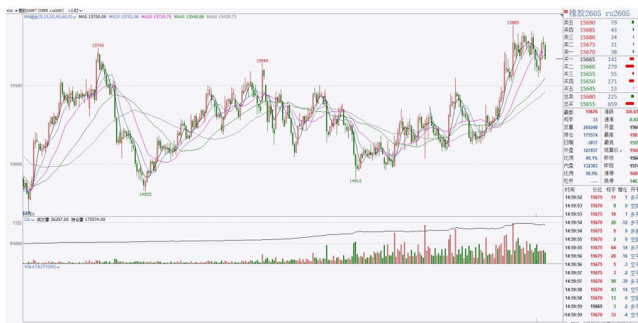
图 3.2：橡胶 2605 小时图