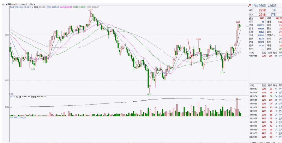
图 8：甲醇 2605 小时图

日度技术面分析：甲醇日线级别中期下跌，短期上涨结构。今日日内增仓放量突破后短期结构再度向上，下方短期支撑 2120 一线。策略上小时周期暂时观望。