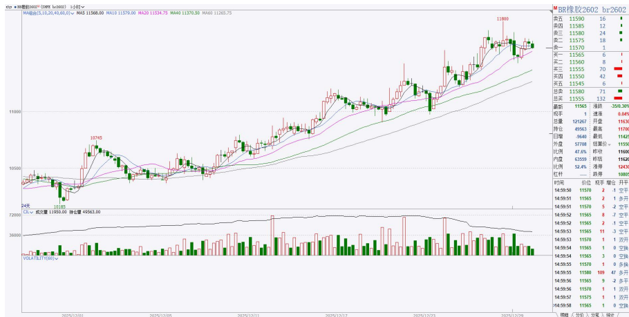
图 4.2：BR2602 小时图