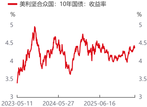
图1: 美利坚合众国: 10年国债: 收益率