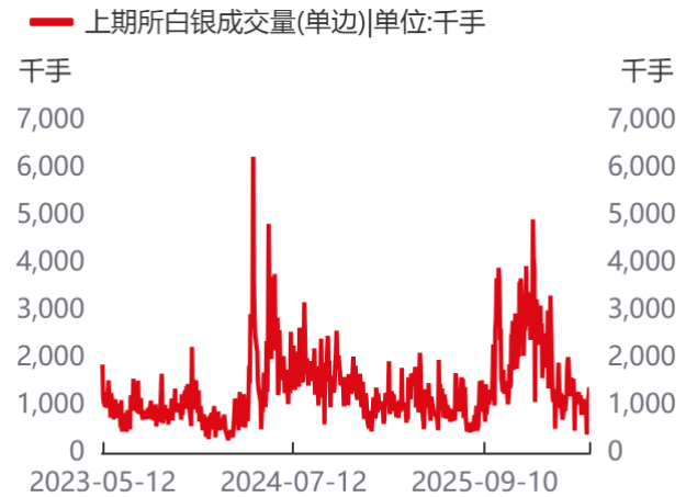
图4: 上期所白银成交量(单边)单位:千手