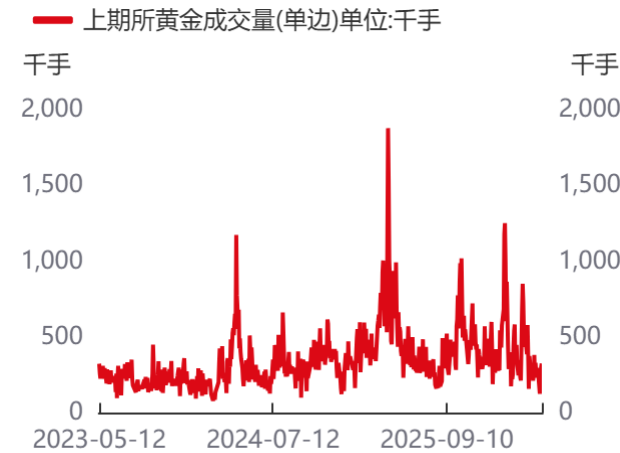
图3: 上期所黄金成交量(单边)单位:千手