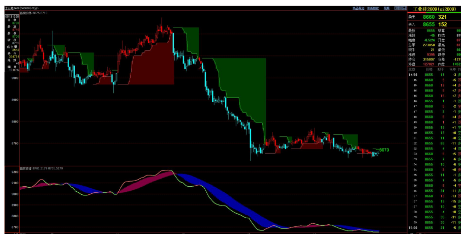
工业硅 2609 合约 5 分钟级别周期