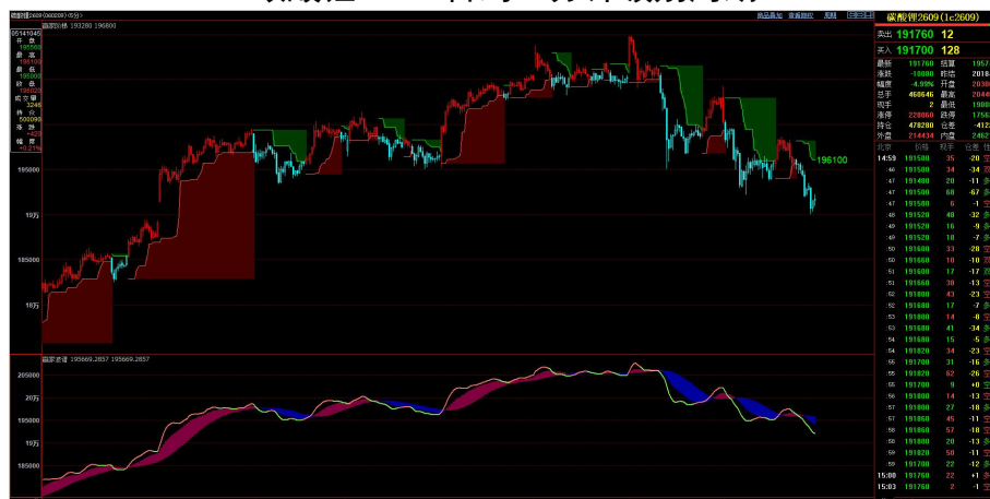
数据来源：博易大师，天富研询