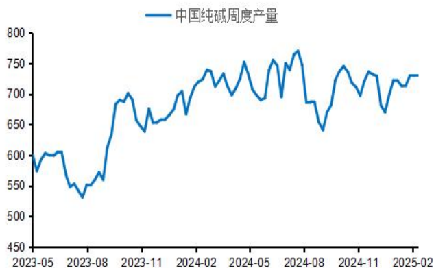
图3：纯碱周度产量（千吨）