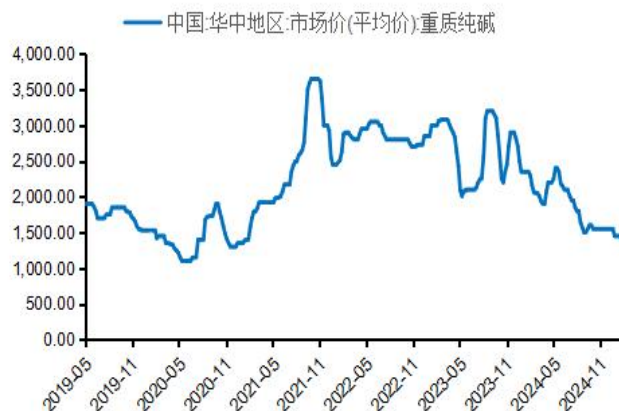
图2：华中重碱市场价格（元/吨）