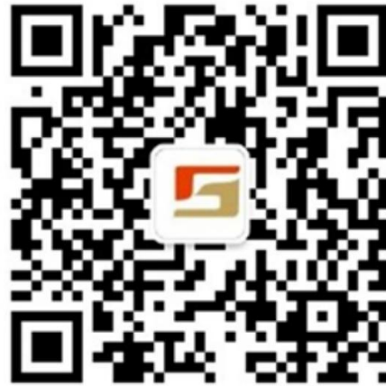
金石期货投资咨询部公众号