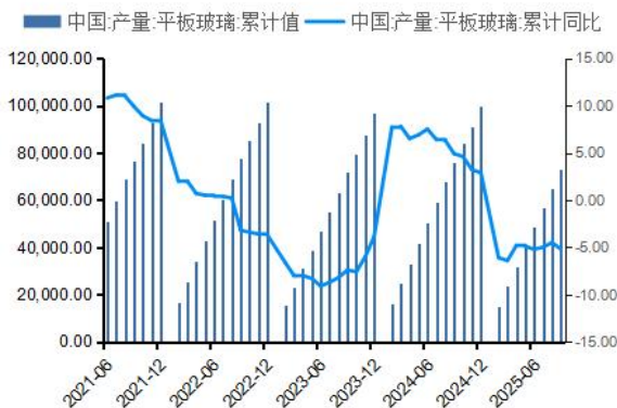
图6：平板玻璃产量（万重量箱）