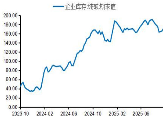
图4：纯碱企业库存（万吨）