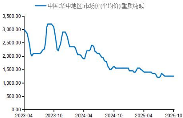
图5：华中重碱市场价格（元/吨）