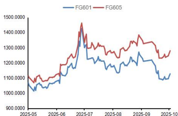
图2：玻璃活跃合约价格走势