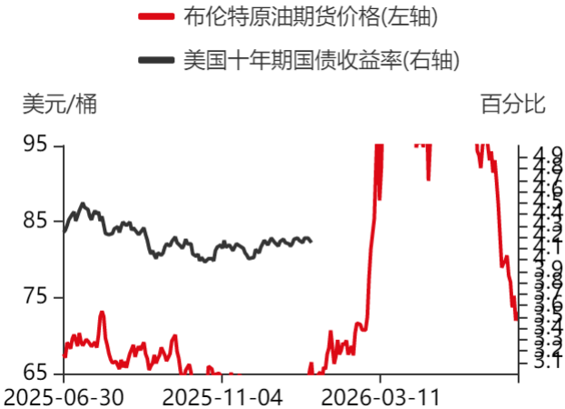
图3：原油期货与美债收益率走势对比