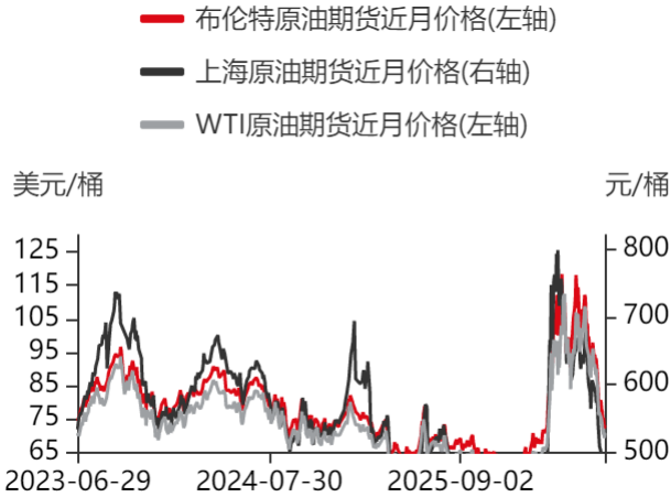
图1：原油期货价格走势