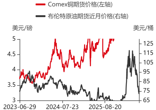
图4：原油期货与铜价走势对比