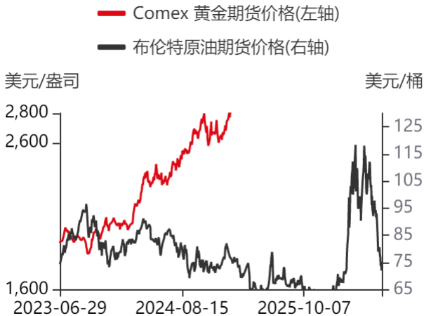
图5：原油期货与金价走势对比