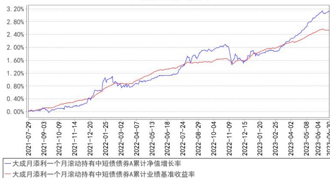
大成月添利一个月滚动持有中短债债券A累计净值增长率与同期业绩比较基准收益率的历史走势对比图

(二) 自基金合同生效以来基金份额累计净值增长率变动及其与同期业绩比较基准收益率变动的比较