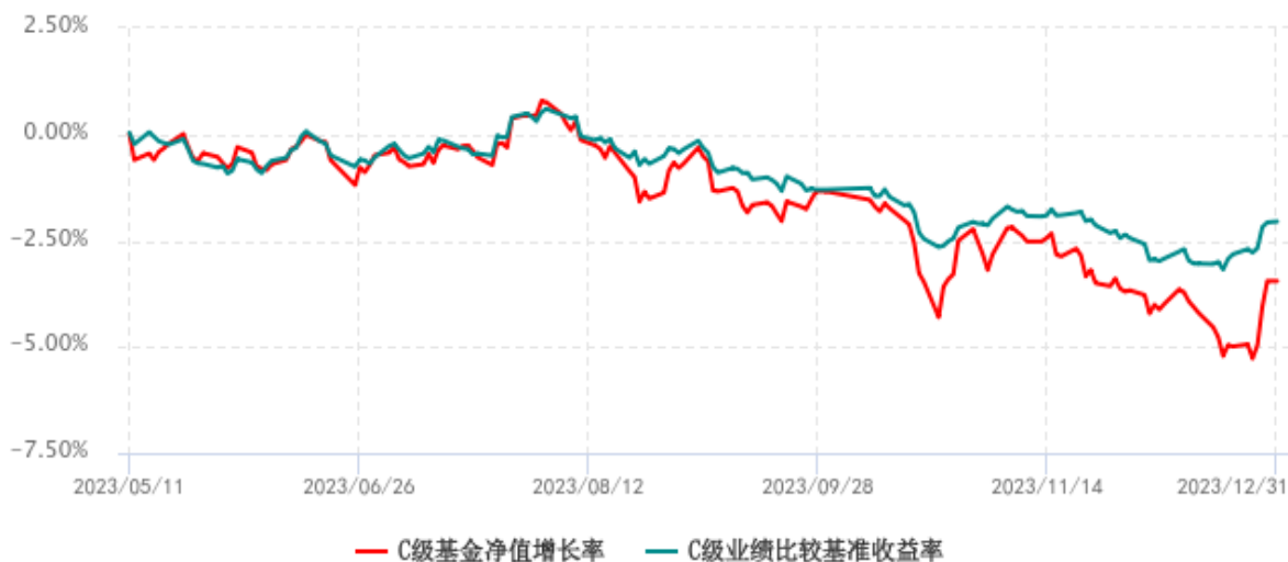
C级基金份额累计净值增长率与同期业绩比较基准收益率历史走势对比图 (2023年05月11日-2023年12月31日)