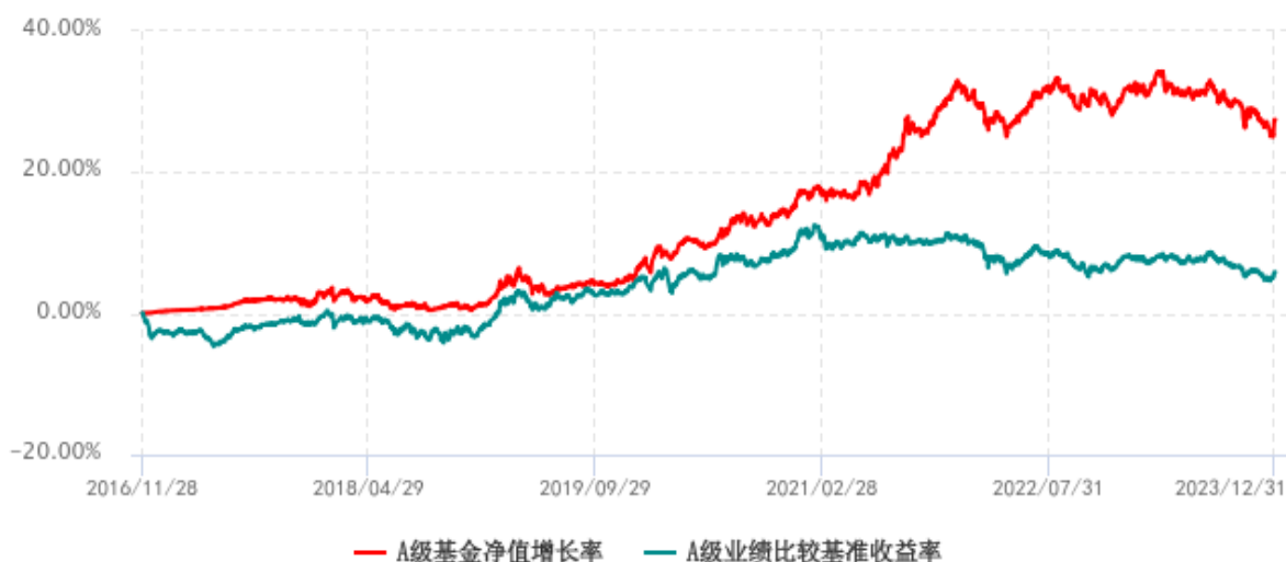
A 级基金份额累计净值增长率与同期业绩比较基准收益率历史走势对比图 (2016年11月28日-2023年12月31日)

注：1. 本基金 A 份额成立于 2016 年 11 月 28 日，C 份额成立于 2023 年 5 月 11 日；