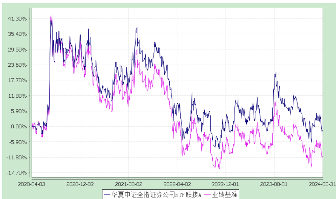
华夏中证全指证券公司 ETF 联接 C: