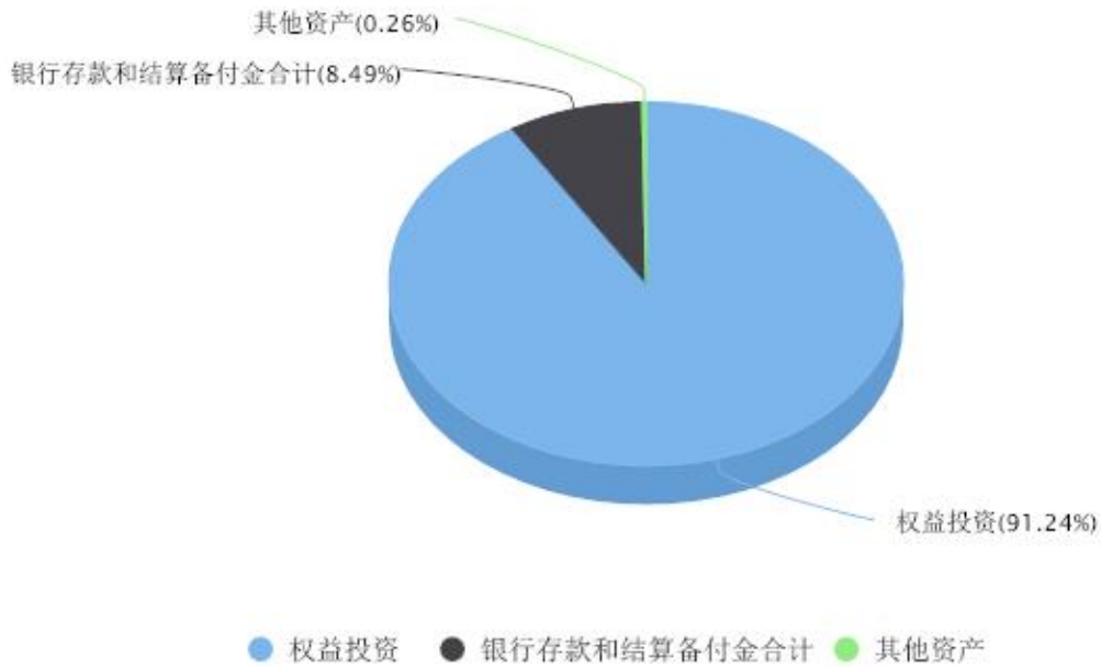
投资组合资产配置图表 数据截止日期:2023年09月30日