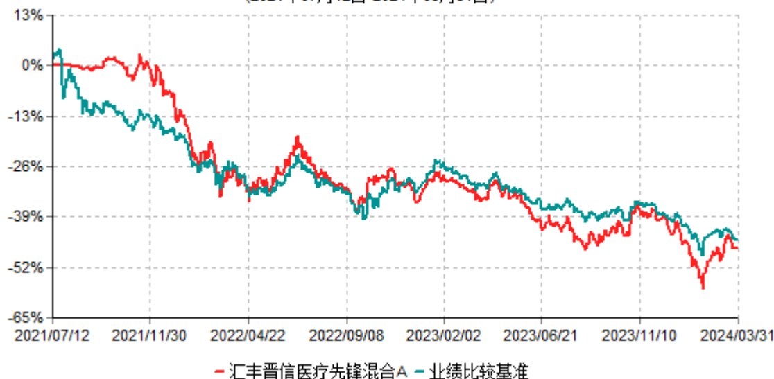
汇丰晋信医疗先锋混合A累计净值增长率与业绩比较基准收益率历史走势对比图 (2021年07月12日-2024年03月31日)