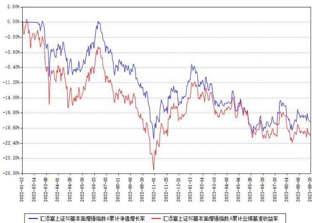
汇添富上证50基本面增强指数A累计净值增长率与同期业绩基准收益率对比图

(二) 自基金合同生效以来基金累计净值增长率变动及其与同期业绩比较基准收益率变动的比较图