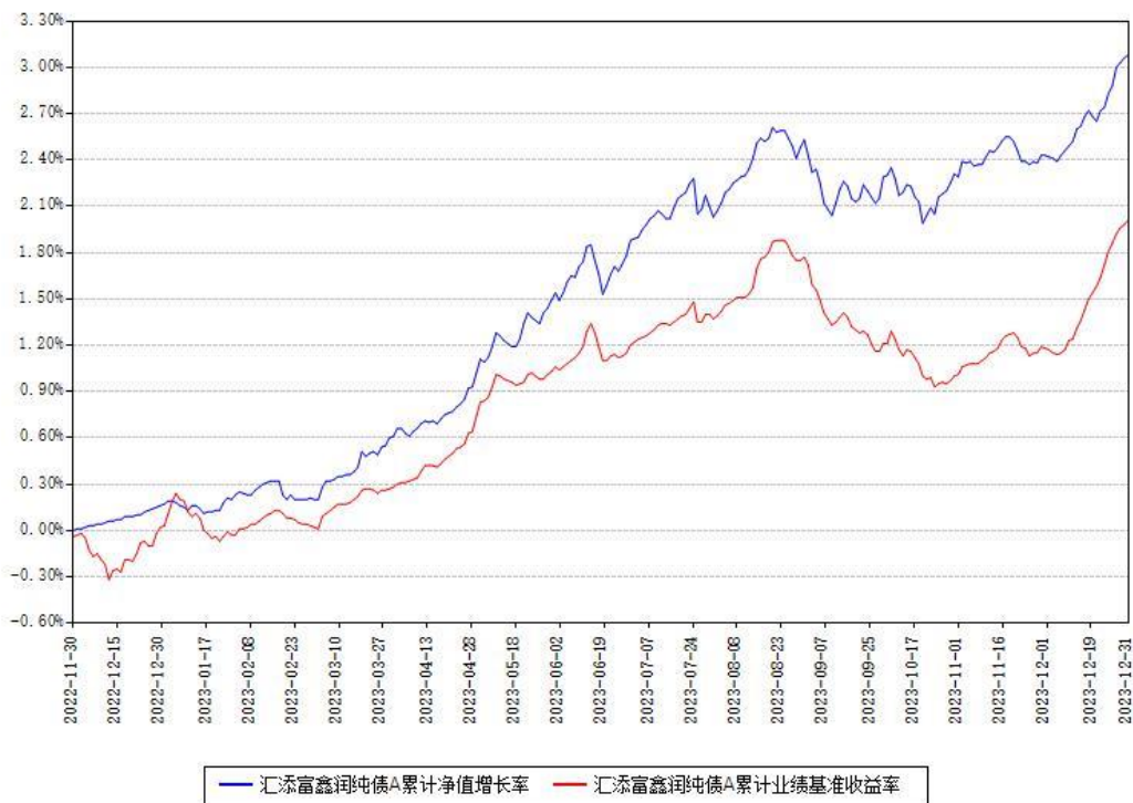
汇添富鑫润纯债A累计净值增长率与同期业绩基准收益率对比图