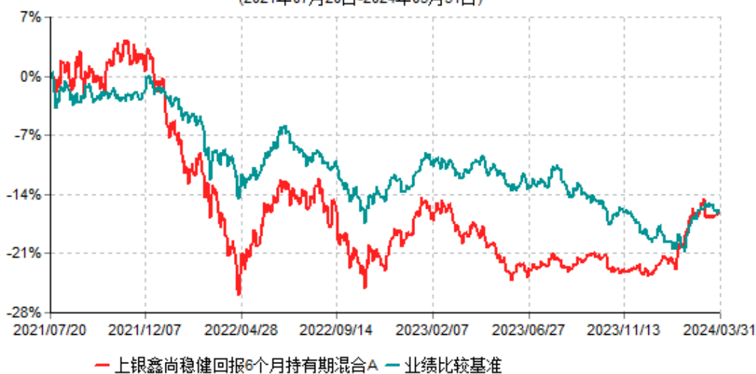
上银鑫尚稳健回报6个月持有期混合A累计净值增长率与业绩比较基准收益率历史走势对比图 (2021年07月20日-2024年03月31日)