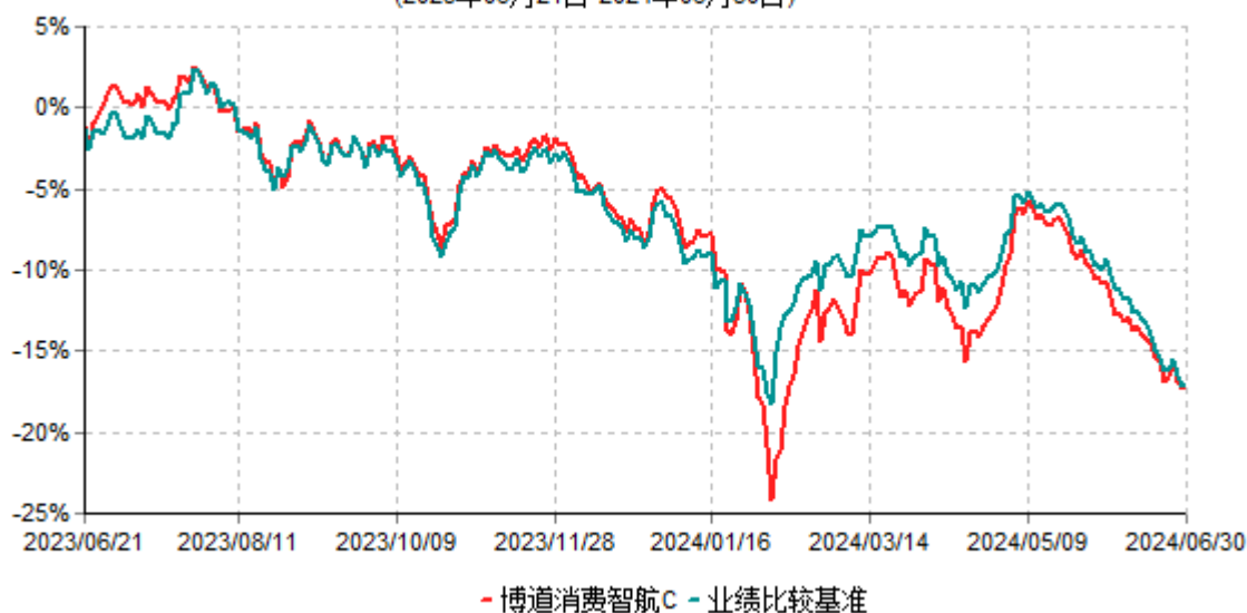
博道消费智航C累计净值增长率与业绩比较基准收益率历史走势对比图 (2023年06月21日-2024年06月30日)

注：1、本基金建仓期为自基金合同生效日起的6个月。截至建仓期结束，本基金各项资产配置比例符合基金合同及招募说明书有关投资比例的约定； 2、本基金自2023年6月20日起增设C类基金份额，该类份额首次确认日为2023年6月21日，本报告期的相关数据和指标按实际存续期计算。