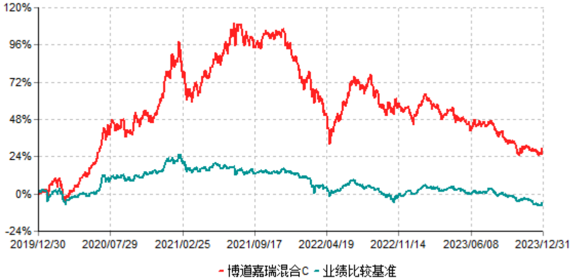
博道嘉瑞混合C累计净值增长率与业绩比较基准收益率历史走势对比图 (2019年12月30日-2023年12月31日)

注：本基金建仓期为自基金合同生效日起的6个月。截至建仓期结束，本基金各项资产配置比例符合基金合同及招募说明书有关投资比例的约定。