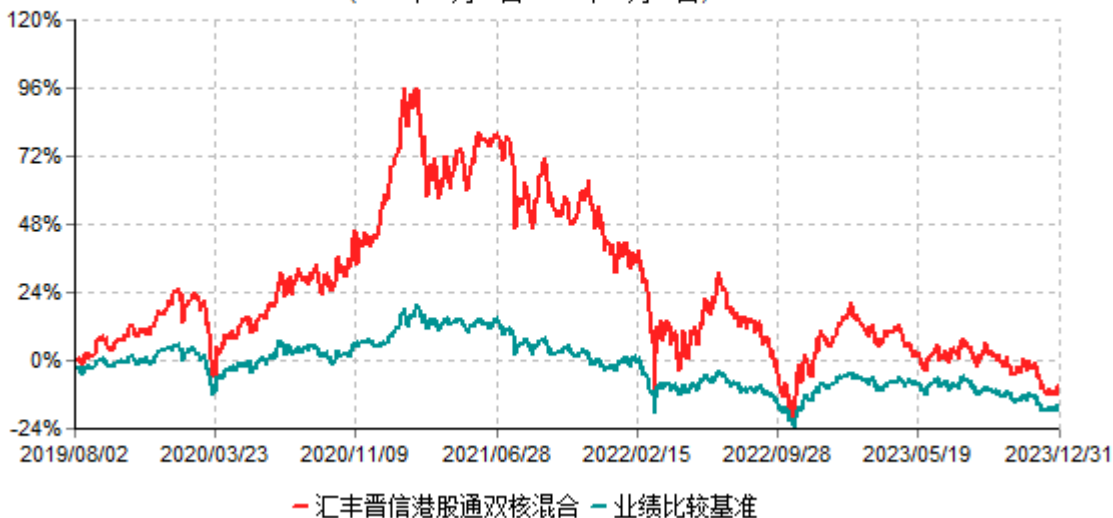
汇丰晋信港股通双核策略混合型证券投资基金累计净值增长率与业绩比较基准收益率历史走势对比图 (2019年08月02日-2023年12月31日)