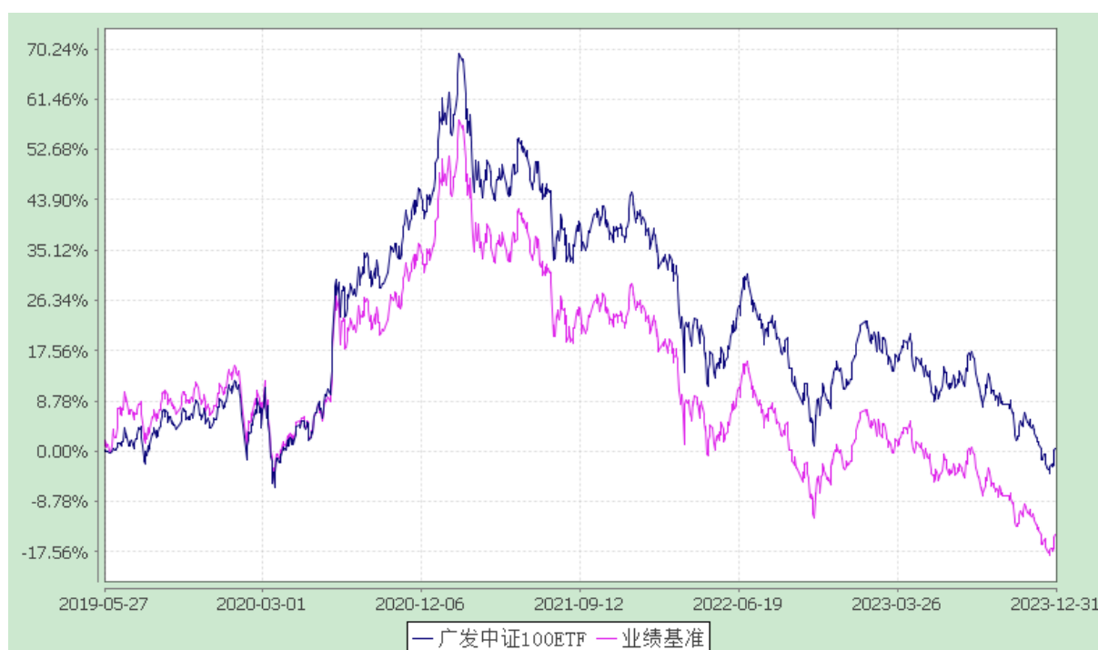
广发中证 100 交易型开放式指数证券投资基金 份额累计净值增长率与业绩比较基准收益率的历史走势对比图 (2019 年 5 月 27 日至 2023 年 12 月 31 日)