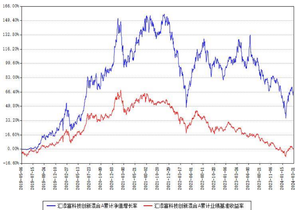
汇添富科技创新混合A累计净值增长率与同期业绩基准收益率对比图

(二)自基金合同生效以来基金累计净值增长率变动及其与同期业绩比较基准收益率变动的比较图