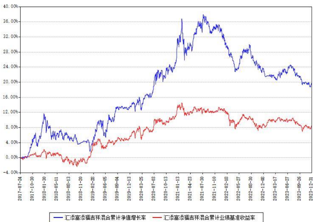
汇添富添福吉祥混合累计净值增长率与同期业绩基准收益率对比图

注：本基金建仓期为本《基金合同》生效之日（2017年07月24日）起6个月，建仓期结束时各项资产配置比例符合合同约定。