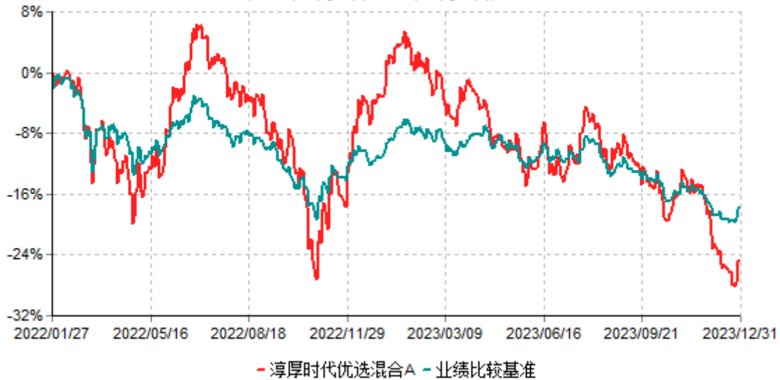
淳厚时代优选混合A累计净值增长率与业绩比较基准收益率历史走势对比图 (2022年01月27日-2023年12月31日)

注：本基金基金合同生效日为2022年1月27日。按基金合同规定，本基金自基金合同生效起6个月内为建仓期。建仓期结束时本基金的各项投资比例均符合基金合同约定。