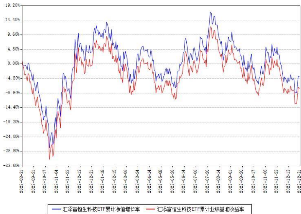
汇添富恒生科技ETF累计净值增长率与同期业绩基准收益率对比图

注：本基金建仓期为本《基金合同》生效之日（2022年08月31日）起6个月，建仓期结束时各项资产配置比例符合合同约定。